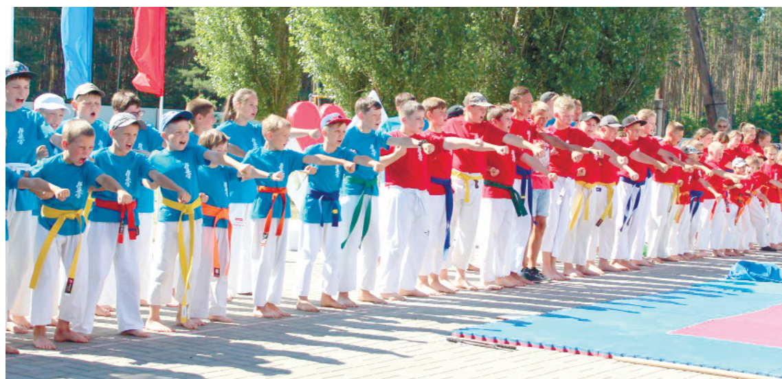
В строю воспитанники школы киокушинкаратэ