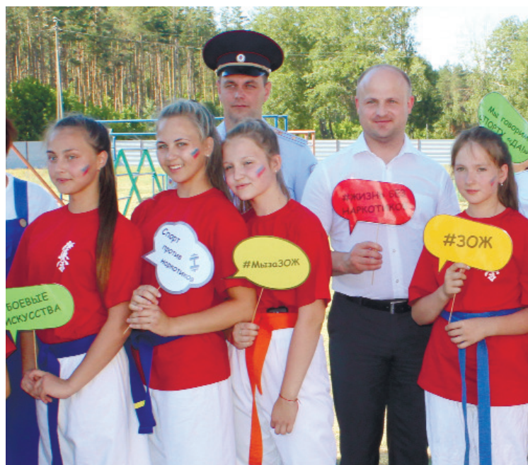
Мы выбираем ЗОЖ