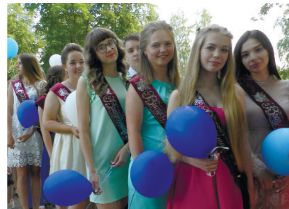
На аллеях парка выпускники школ района