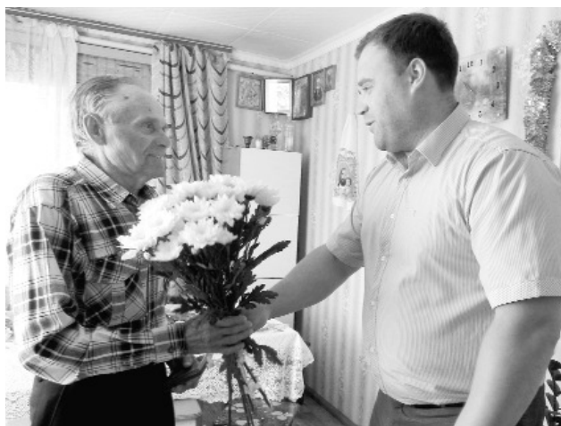
Цветы в знак благодарности и уважения