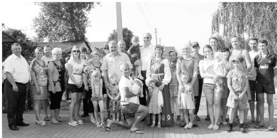
Общая фотография на память

Повод для встречи приятный. По целевой программе строительства и ремонта муниципальных автомобильных дорог общественного пользования по городу Рассказову на 2018 год за счет средств областного бюджета при частичном софинансирова-