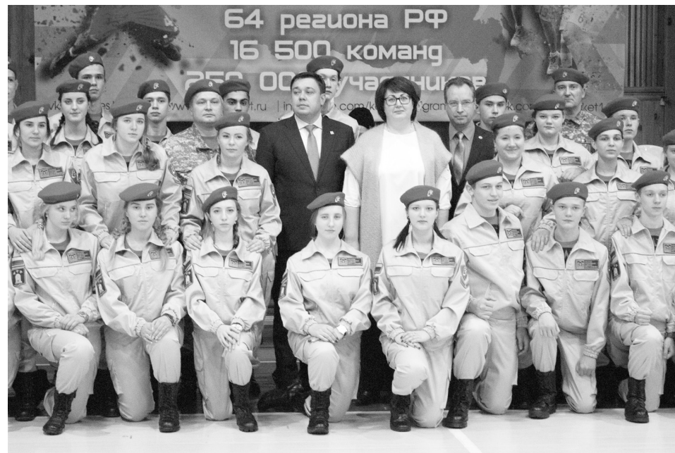
Юнармейцы - новое поколение защитников Отечества

- Сейчас переходный период. Есть две формы военной подготовки в гражданском вузе: на кафедре и в военном учебном центре. С одной стороны, происходит унификация этих форм, при которой кафедры трансформируются в центры. С другой, продолжают создаваться и кафедры. Знаю точно о плане открытия в самом скором будущем в гражданских вузах ещё шести военных кафедр. Процесс трансформации военных кафедр в военные учебные центры, судя по всему, - дело времени. Уже сейчас мы подготовили все документы на подготовку офицеров запаса. Осваиваем вторую ступень военного образования. Я всегда привожу слова известной итальянской поговорки: «Мы долго шли и пришли». Мы свою цель в деле создания военного образования в Тамбовской области точно достигли, выиграли эту конкуренцию. Но для нас эта цель, как и любая другая, никогда не являлась конечной. Наш «мозговой трест» неустанно размышляет о динамике развития университета. Время перемен, как я уже говорил, диктует свои законы. И мы им неукоснительно следуем.