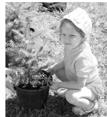
Дети - первые помощники