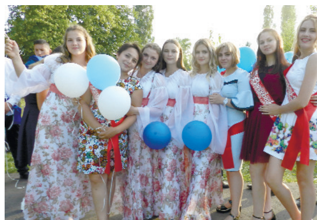
На празднике всем было весело