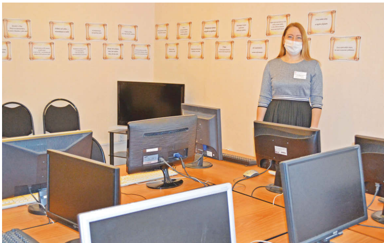
■ В центре занятости населения №3 большое внимание уделяется психологической службе

В этом году оказано более 5,5 тысячи госуслуг, что в 1,4 раза больше чем за 2019 год, трудоустроено свыше 1,7 тысячи человек, что в 1,3 раза больше, чем в прошлом году. Численность безработных сократилась на 42%, уровень безработицы снизился с 2,9% до 1,7%.