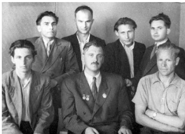
Сергей Михалков и тамбовские писатели

Писатель не имеет права на обман и лукавство. Нам, Союзу писателей России, есть чем заниматься и с чем идти к читателю. Наш главный герой — человек, который, как Прометей, несёт людям свет, по сути, несёт добро. А вот в чём оно выражается — здесь у каждого писателя есть свой авторский взгляд.