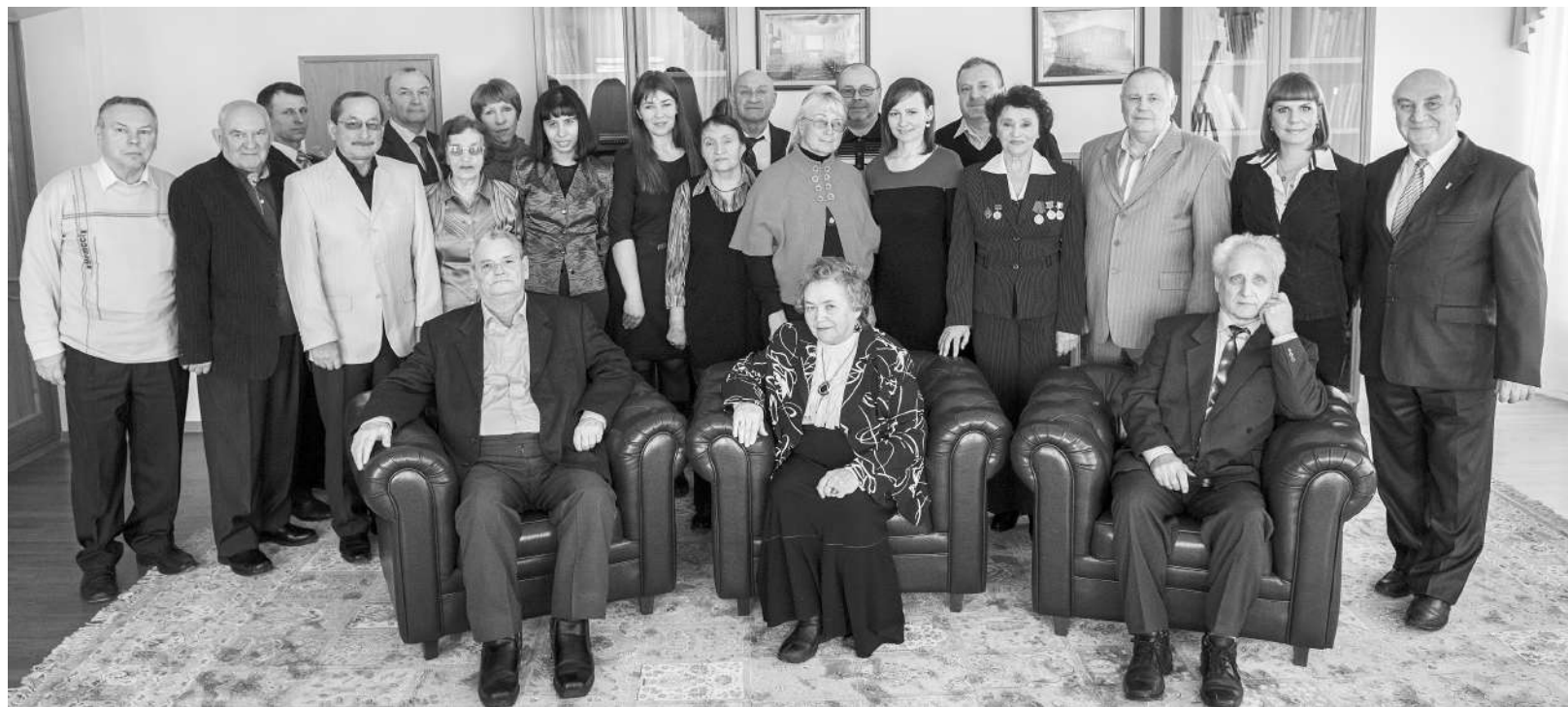
Тамбовские писатели, 2015 год

Цифровая постмодернистская эпоха многое изменила в нашей жизни. Появились новые средства массовой информации, появилось племя интернет-блогеров, которые смело конкурируют с писателями