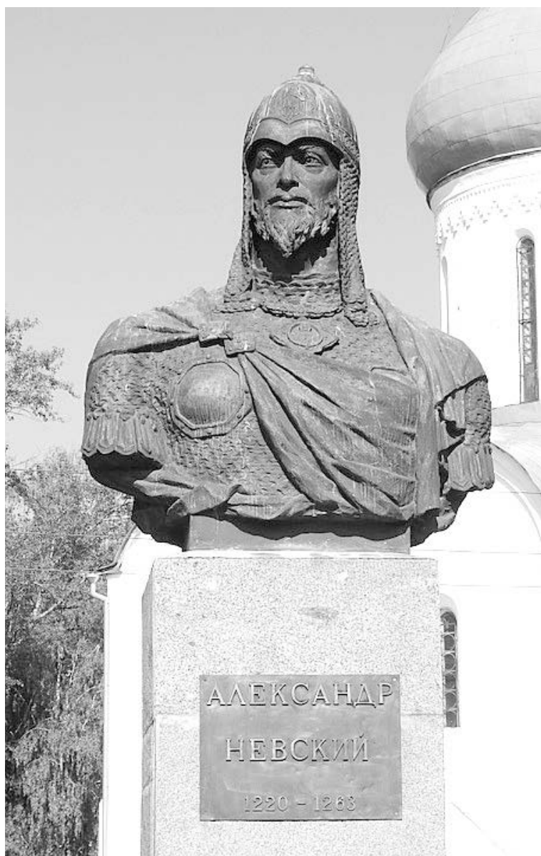
Памятник Александру Невскому в Переславле-Залесском

Вспоминаю, как жители Ленинграда приходили в полуопустошённый обезображенный Троицкий собор Александро-Невской лавры. На полу мусор, грязь, производственные отходы. И помню, с каким энтузиаз-